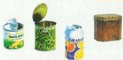
Boîtes de gâteaux, de conserve... et boîtes de boisson